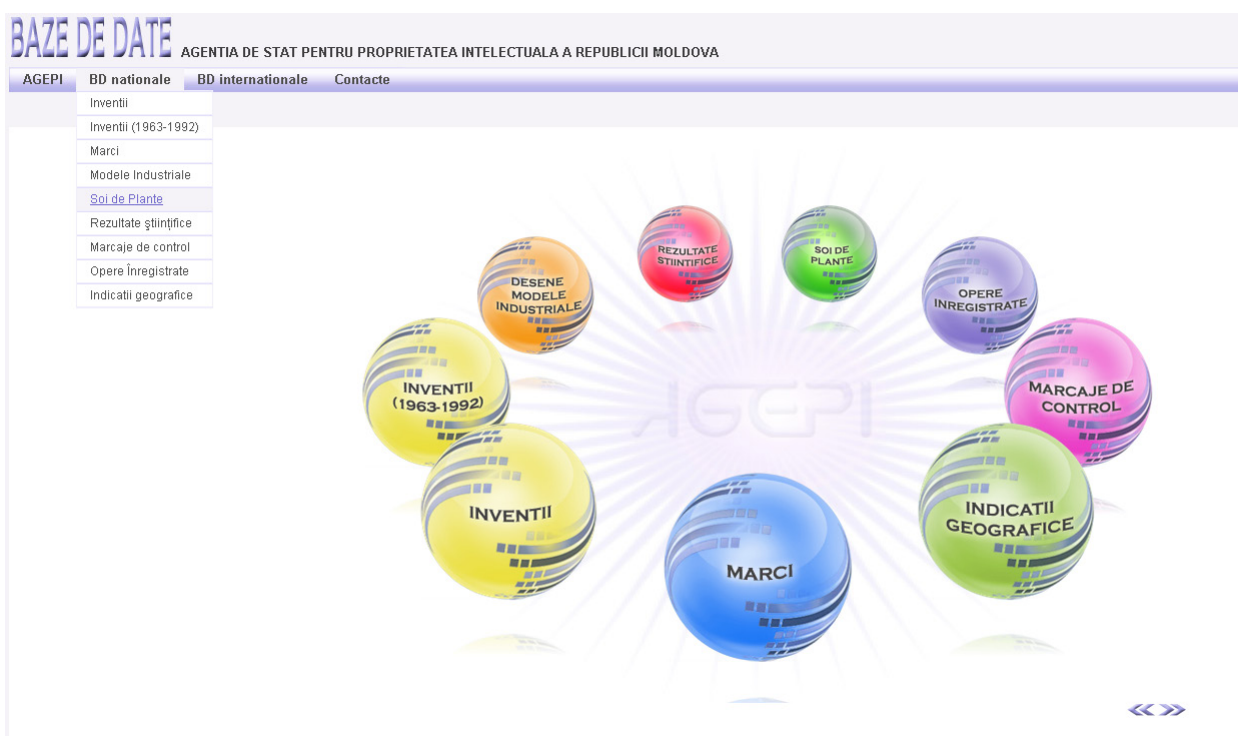
Fig. 1. Pagina de start

Bazele de date publice AGEPI se află la adresa http://db.agepi.md/ . Programul de documentare se lansează fie din meniul „BD naționale/Soiuri de plante”, fie accesând sfera „Soiuri de plante” sau la adresa http://www.db.agepi.md/SoiDePlante